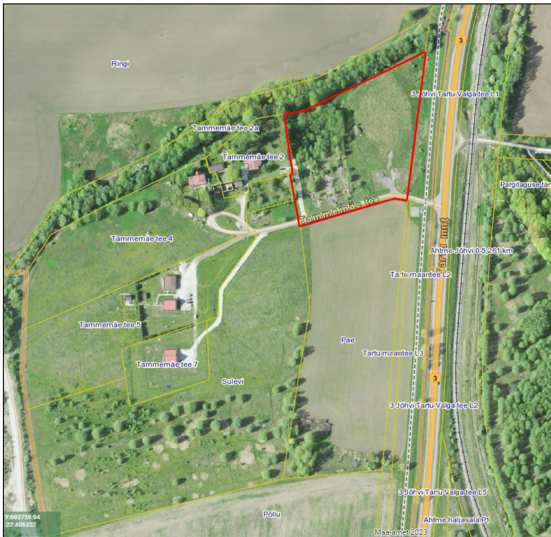
Skeem 1. Planeeritava maa-ala piir (algatamise korralduse kohane)

DP alal ega selle lähiumbruses ei asu keskkonnaregistrisse kantud veekogusid. Planeeritav ala piirneb põhjast Tammemäe tee 2a üldkasutatava maaga, kus asub ilma kitsendusteta 6-8 meetrine kraav ETAK ID-ga 4452344. Mainitud kraav on ühendatud Sulevi kinnistu loodepiiril paikneva kraaviga.